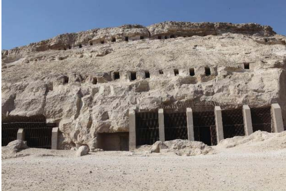
Gebel Asyut al-gharbi. Vista hacia algunas de las tumbas excavadas en la montaña, entre ellas la Tumba III y IV.

La necrópolis en Gebel Asyut al-gharbi se caracteriza por presentar tumbas excavadas en la roca. ¿Qué tipo de tumbas han sido encontradas hasta la fecha? ¿Se puede obtener un desarrollo arquitectónico durante época faraónica a través de las tumbas?